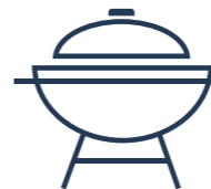
4 Zonas de Parrillas