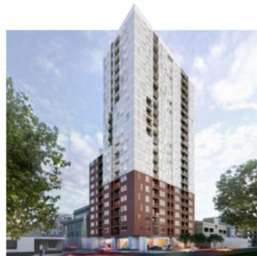
CERCADO DE LIMA

MIRADOR DEL GOLF LIMA ESTE - ÑAÑA ENTREGADO