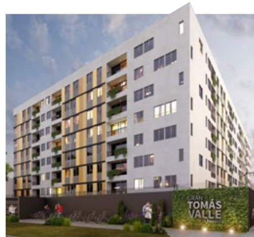
SAN MARTÍN DE PORRES