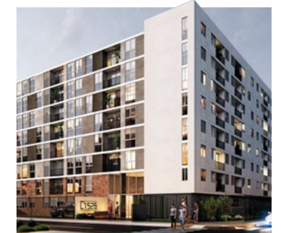
BREÑA - PUEBLO LIBRE