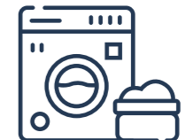
Centro de Lavado