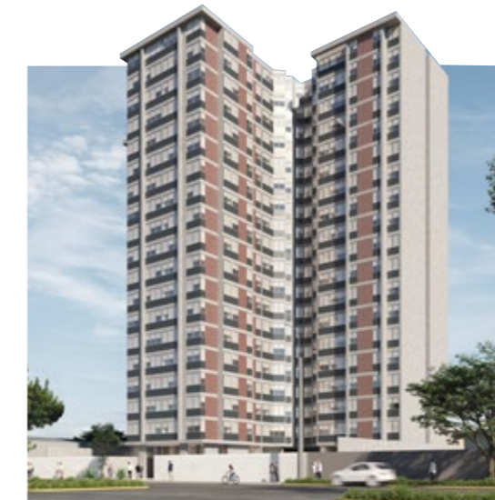
CERCADO DE LIMA

GRAN PARQUE ROMA CERCADO DE LIMA ENTREGADO