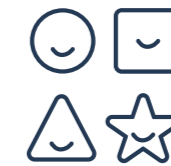
Zona de Niños