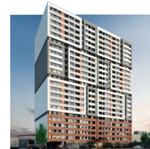
CERCADO DE LIMA