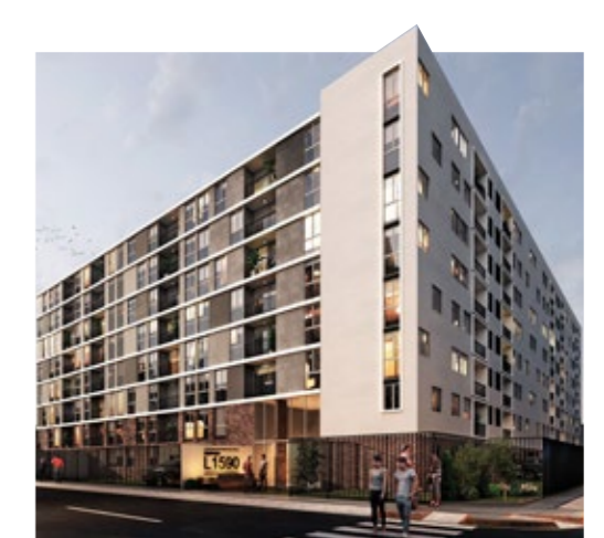
BREÑA - PUEBLO LIBRE