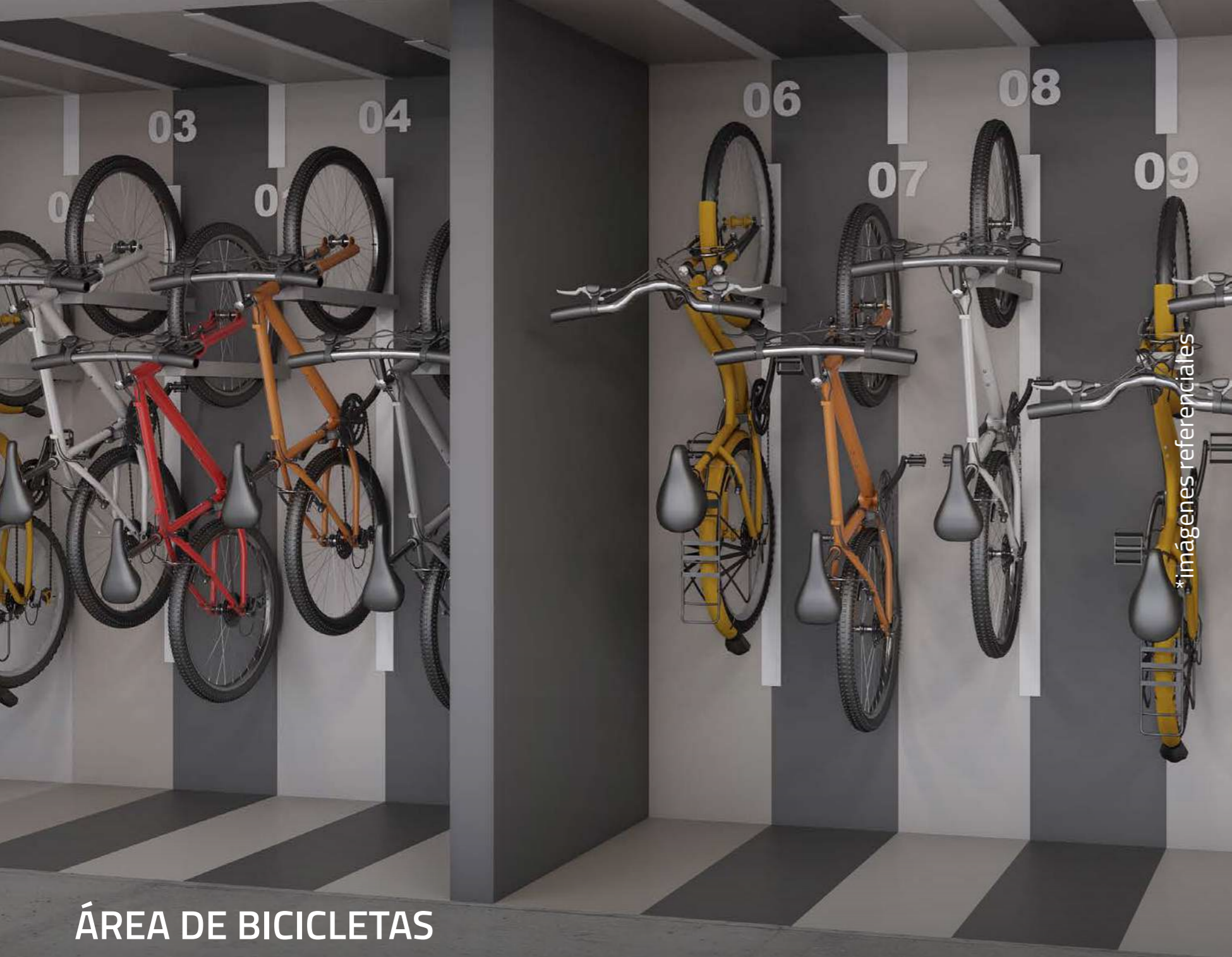
ÁREA DE BICICLETAS