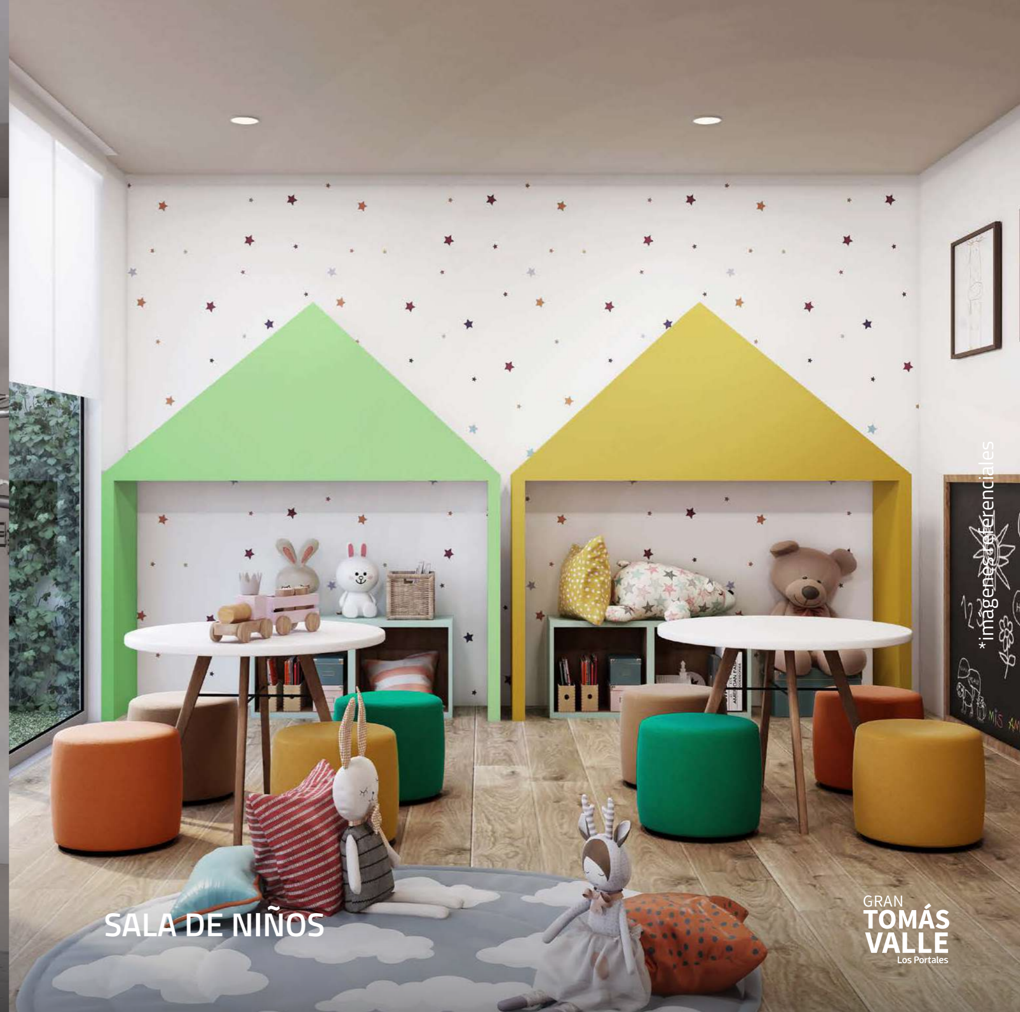
SALA DE NIÑOS